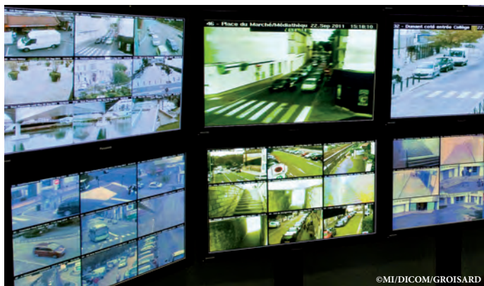
Une sécurité améliorée grâce à la vidéoprotection.

de veiller à la sécurité de ses citoyens. Ainsi, cinq brigades de cinq agents se relayent tout au long de la journée afin d'apporter davantage d'efficacité à leurs actions. Un dispositif complété par deux brigades dites "de proximité".