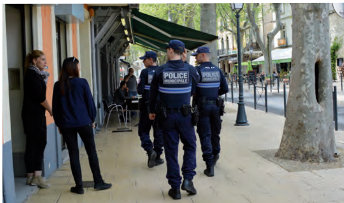
La police assure ses patrouilles à pieds, en voiture ou en vélo.

Rappelons que le poste de police vous accueille de 8 h à 12 h 30 et de 13 h 30 à 17 h du lundi au vendredi pour renouveler vos papiers d'identité, certificats d'immatriculation ou établir des attestations d'accueil.