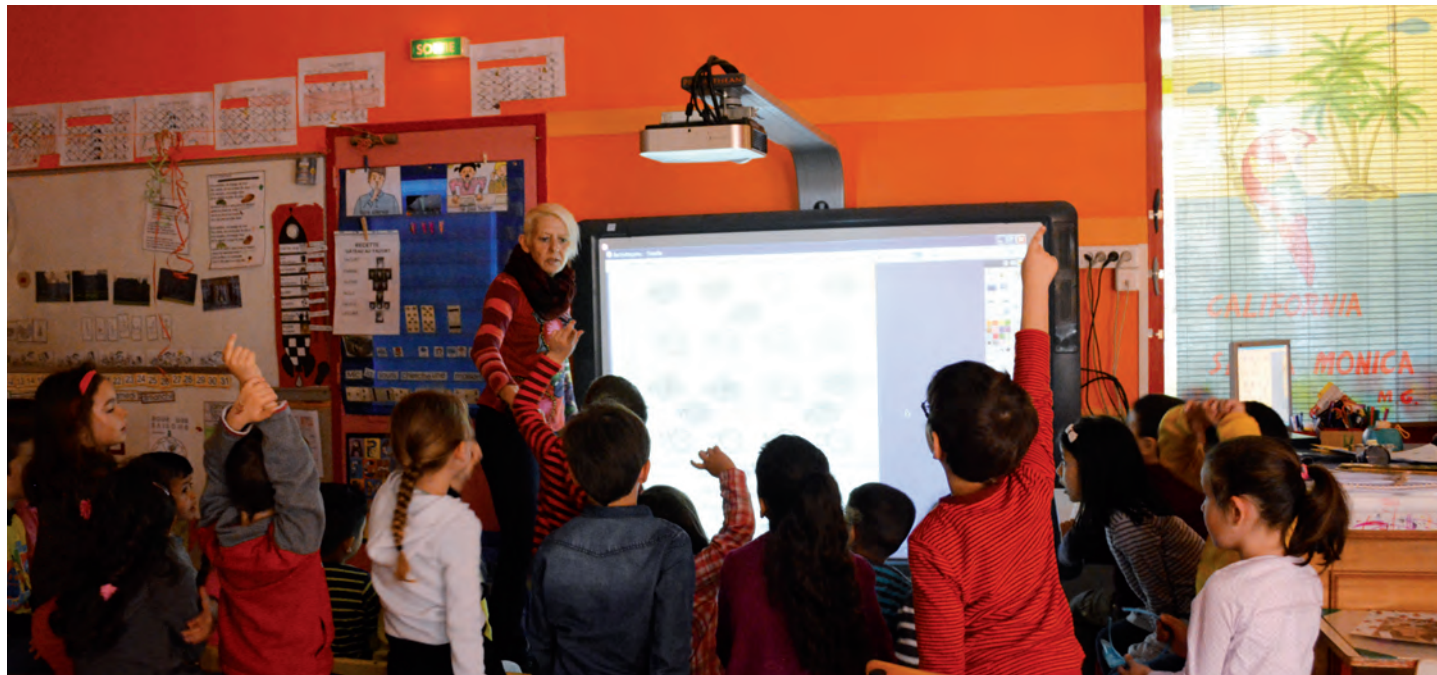
Les élèves sont très réceptifs face au tableau blanc interactif.