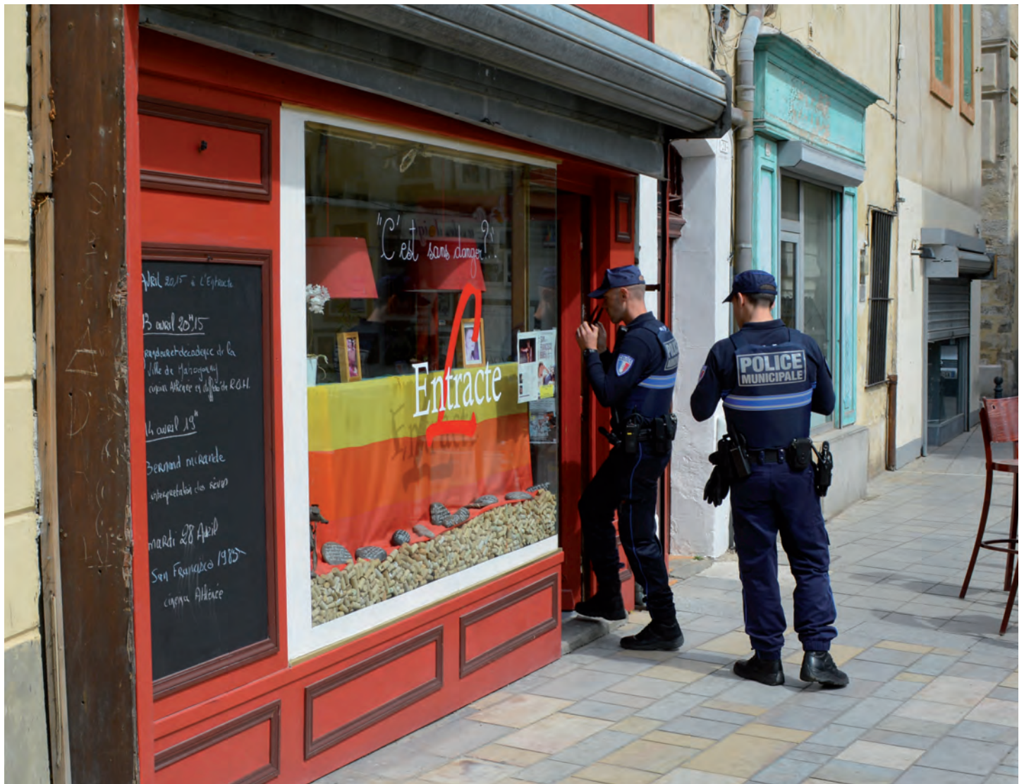
Sécurité renforcée aux abords des commerces.

L'objectif de la police municipale est de garantir la sécurité des citoyens. Ainsi, à Lunel, les effectifs sont prêts à intervenir 24 heures / 24 et 7 jours / 7. Un véritable service de proximité qui tire un bilan positif des actions menées en 2014.