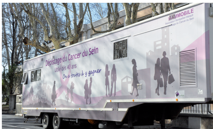
Lunel s'engage dans la lutte contre le cancer du sein.

En bref, pour accéder à des soins convenables, Montpellier semblait être l'unique solution. Une logique coûteuse et compliquée pour les quelque 100 000 habitants du bassin lunellois. La Ville de Lunel a donc cherché à enrichir l'offre de soins.