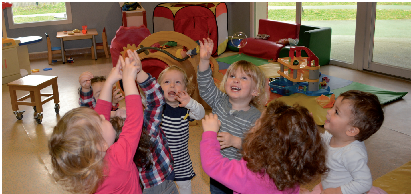
Entre 70 et 80 enfants passent par le Manège enchanté chaque année.