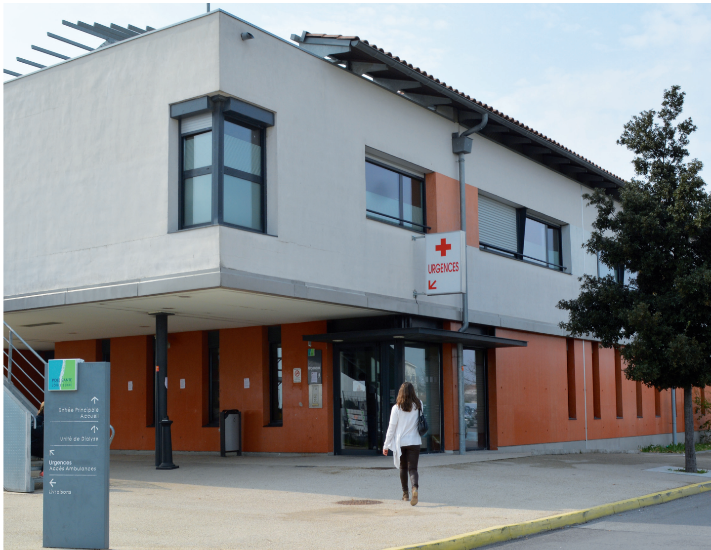
Le pôle santé Professeur Louis Serre a été inauguré en 2007

Depuis le début des années 2000, la municipalité concentre ses efforts sur l'élargissement de l'offre de soins. Avec l'extension du pôle santé Professeur Louis Serre, c'est une nouvelle étape qui est franchie.