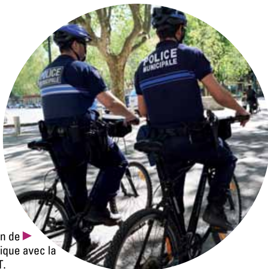
Sécurisation de ► la voie publique avec la brigade VTT.