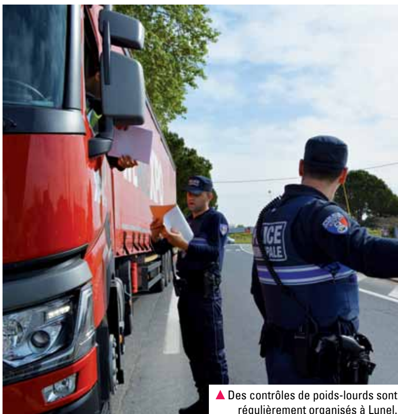
▲ Des contrôles de poids-lourds sont régulièrement organisés à Lunel.