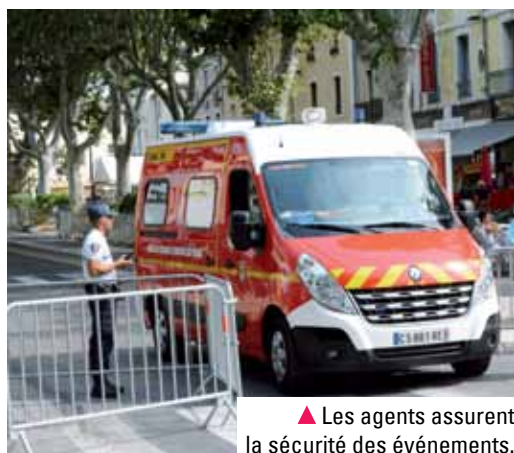
▲ Les agents assurent la sécurité des événements.

La police municipale de Lunel est l'une des rares polices à être opérationnelle 24 h / 24 et 7 j / 7. Une présence constante qui permet aux agents d'assurer la sécurité des Lunellois, de faire respecter les arrêtés municipaux et de veiller au bon ordre public. ■