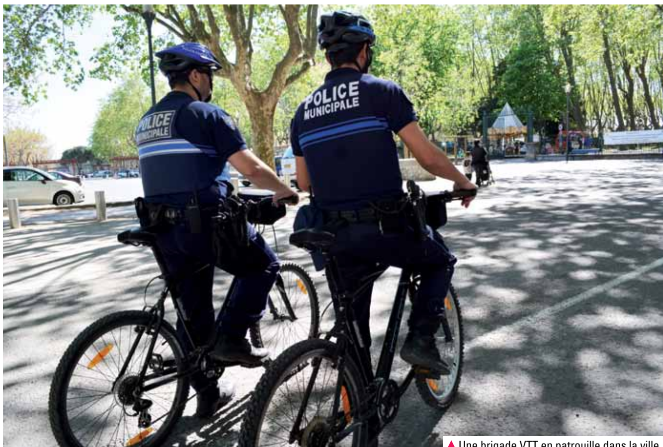
▲ Une brigade VTT en patrouille dans la ville.