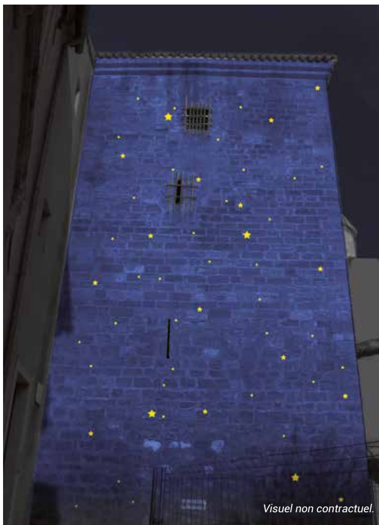
Visuel non contractuel.