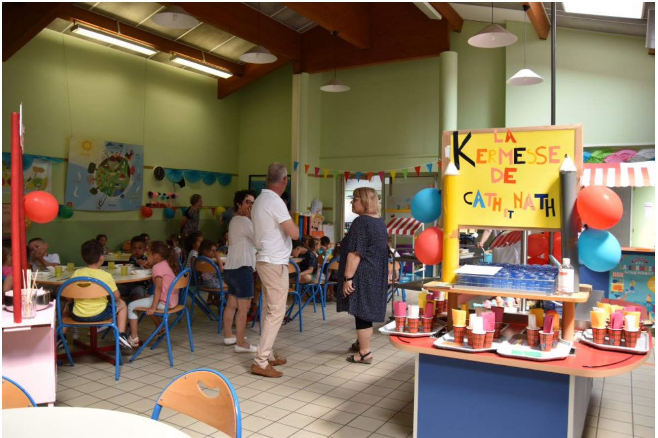
En images : la Kermesse de l'école Mario Roustan